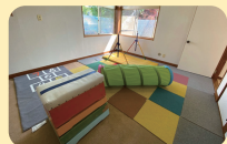
プレイルーム (体育スペース)