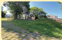
施設の目の前には大きな公園