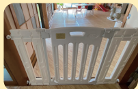
安全対策も万全に