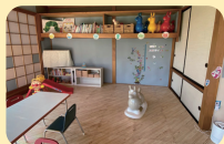
メインルーム (知育スペース)