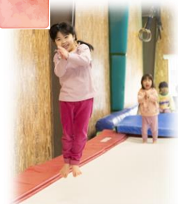
体操競技専用体育館で豊富な器具を用いての楽しいレッスン