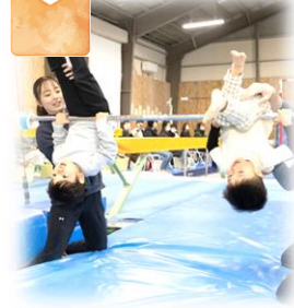
体操競技選手を育成する指導者が豊富な経験と知識でどの競技にもつながる正しいレッスン