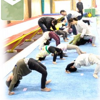
兄弟姉妹で通いやすい複合クラスが盛沢山